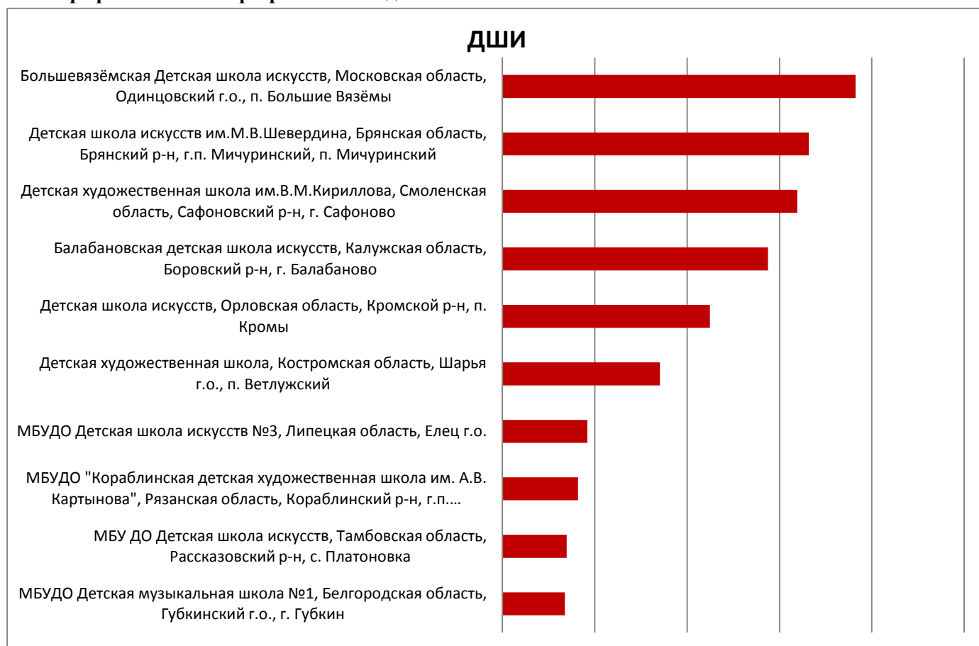
График №13. На 1 февраля 2022 года.