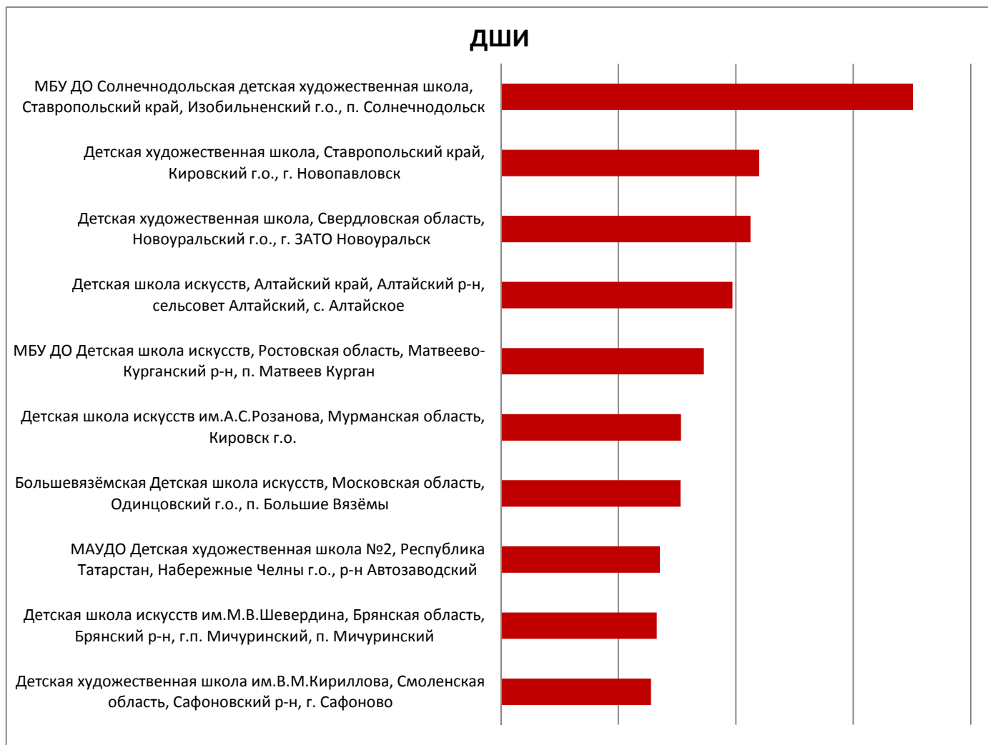
График №1. На 1 февраля 2022 года.